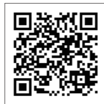
施設映像はこちら