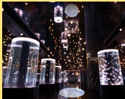
「海月 (クラゲ)」の展示にちなんだ 【お月見スポット】