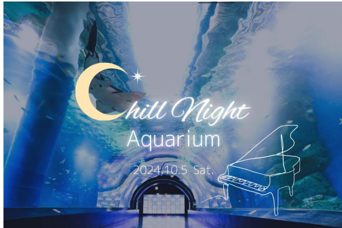
「Chill Night Aquarium ※イメージ」

人数限定・閉館後のゆったりとした館内で水槽見学やナイトドルフィンパフォーマンスがお楽しみいただけます。さらに、トンネル型水槽「ワンダーチューブ」ではピアノの生演奏を開催し、イベント名「Chill=くつろぎ」を体現する癒しの時間をお届けします。この他にも、同イベントだけの特典としてマイチェア ※ や三脚のお持ち込みが可能。お好きなシーンでリラックスするもよし、お写真撮影に没頭するもよし。それぞれのお好きな過ごし方で【癒しの秋】を満喫する、特別な一夜をお過ごしいただけます。