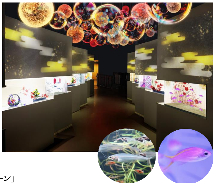
写真左:トランスルーセントグラスフィッシュ/右:パープルクイーン」