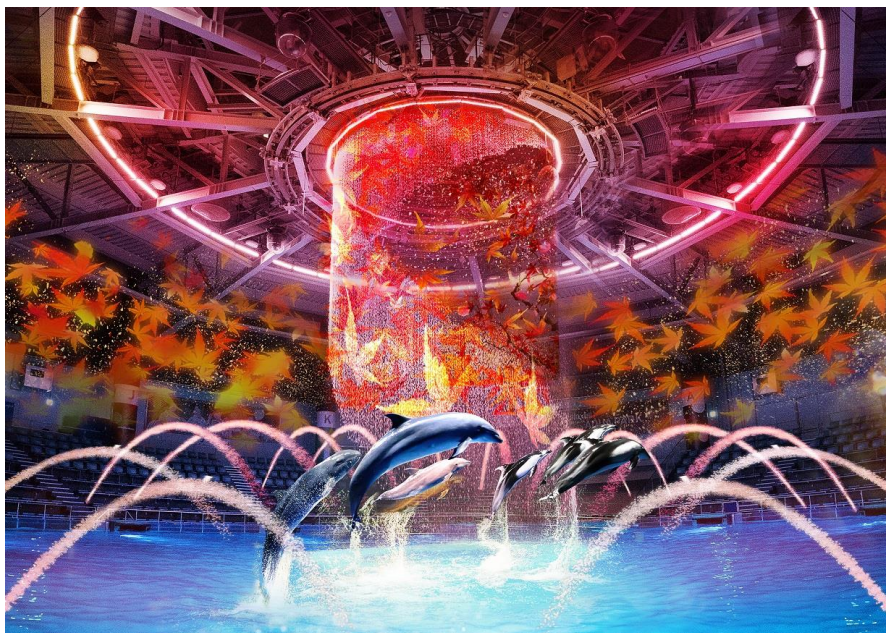
「秋彩絵巻 ※イメージ」

まるで雅楽演奏会を思わせる、イルカたちの雅やかなパフォーマンス。ゆったりと 【秋の夜長】 を満喫いただけます。