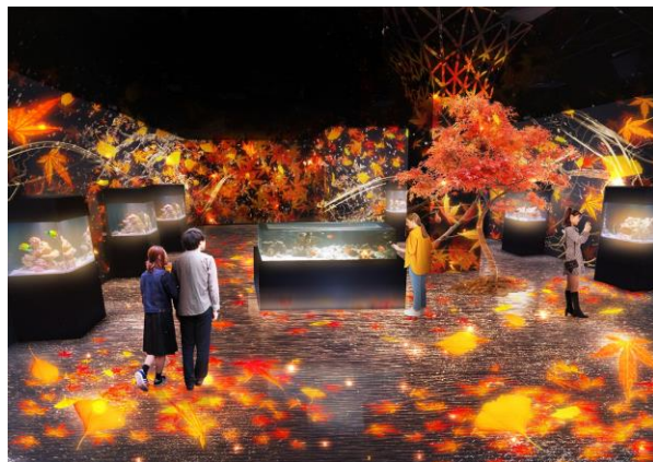
「錦秋の海中庭園ショータイム ※イメージ」

圧倒的な映像演出でゲストを魅了し、彩りあふれる秋の世界への没入体験を提供します。