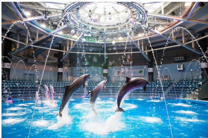
「Harvest festival ※イメージ」

“収穫祭”ではカントリー調の楽曲にのせた変形技の数々、 そしてスプラッシュ演出が会場を盛りあげます。ゲストも その場でできる簡単なダンスでお祭りにご参加いただけ、 【実りの秋】 を祝うにぎやかな時間をお届けします。