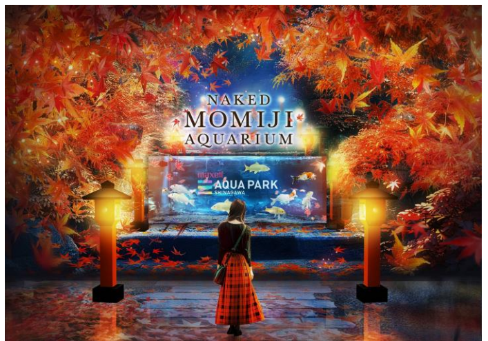
「舞紅葉の物語 左:昼のシーン/右:夜のシーン ※イメージ」