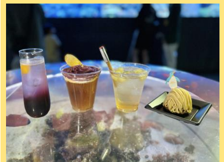
【食欲の秋】を満たす、 4種類の限定メニュー！