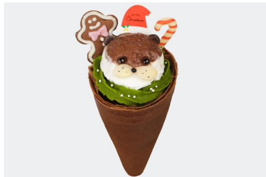
「カウソサンタさんのクリスマスクレープ」 料金：店内850円・テイクアウト835円 場所：海 Cafe