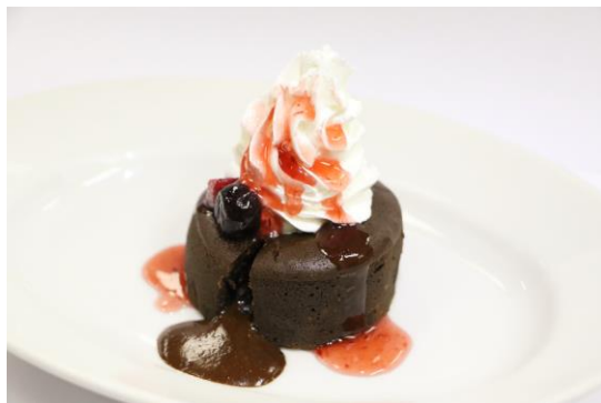
「フォンダンショコラ」 料金：690円 場所：ドルフィン