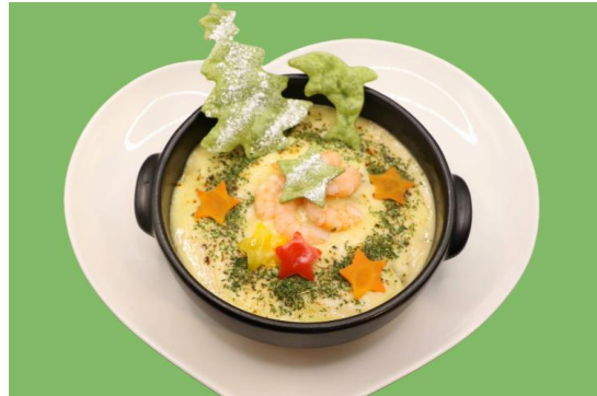
「クリスマスエビドリア」 料金：1,980円 場所：潮騒料理 哉介