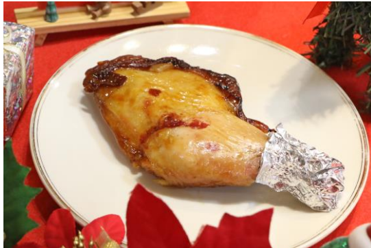
「ローストチキン」 料金：600円 場所：シーパラダイス食品館

島内のレストランや軽飲食店舗では、ローストチキンをはじめ、サンタクロースの見た目も可愛いクレープなど、クリスマスにぴったりのオリジナルメニューが登場いたします。心も体も温まるメニューを多数ご用意しておりますので、ほっと一息つきながら、冬のシーパラを存分にお楽しみください。