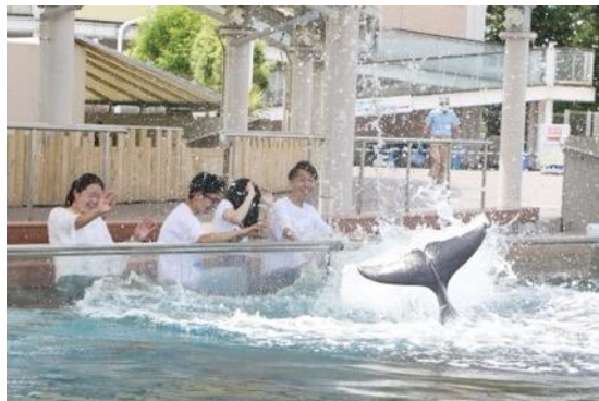
バンドウイルカのスプラッシュタイム

暑い夏は開放的な空間で、イルカたちによる涼しい“ずぶ濡れの夏”をお楽しみください。